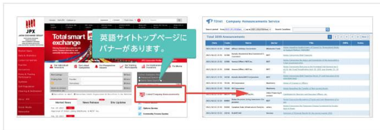
東証ウェブサイトの英文資料一覧画面